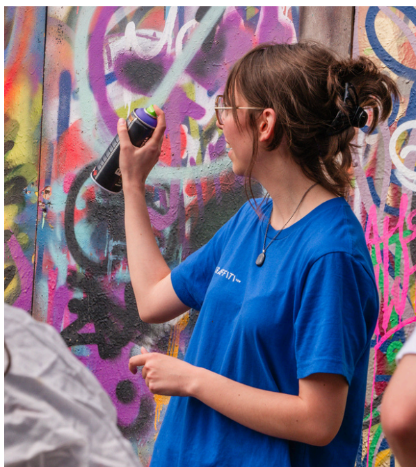
Nette geeft uitleg aan de groep